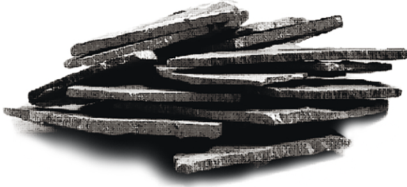
Ergitme Sonrasında Mikrokristalin Master Alaşımlar