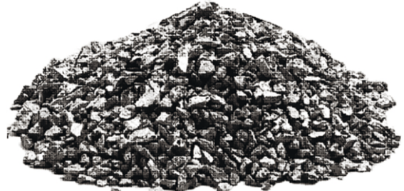
Kırma İşlemi Sonrasında Mikrokristalin Master Alaşımlar

Doğru master alaşım seçimi, maksimum ürün verimi ile kaliteli dökümler üretmek için yaptığınız harcamaları en aza indirmenizi sağlar.